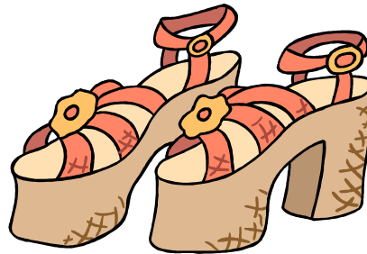
Zapatos NO Apropriados